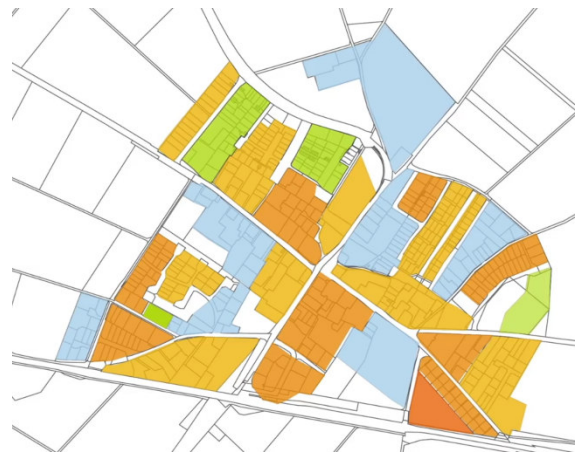
Video-Tipp: Der Kommunale Wärmeplan